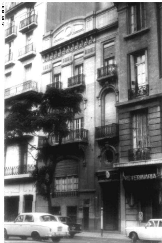
Antigua sede del Conservatorio Nacional de Música Avenida del Callao 1521, Buenos Aires

El Plan de Estudios se anunció en el Artículo II del Decreto de creación y constó de cuatro Secciones: