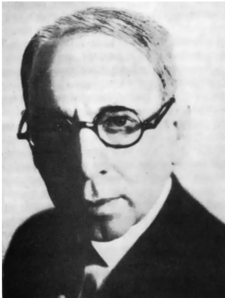
Carlos López Buchardo (1881-1948)

E l origen de una enseñanza musical de carácter oficial en Argentina quizá haya que buscarlo en el intento de creación, en 1874, de la Escuela de Música y Declamación de la Provincia de Buenos Aires en La Argentina, la que no llegó a cubrir las expectativas depositadas en ella.