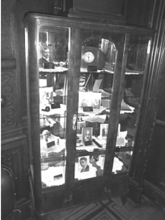
Vista parcial del museo del Conservatorio Nacional

Hoy el IUNA es una realidad que crece día a día y el Conservatorio acompaña este desarrollo desde su posición de entidad rectora de la enseñanza musical en la Argentina.