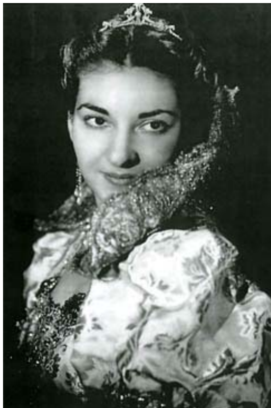
En Los Puritanos , Venecia (1949)

Abarca un poco más de una década, y es relativamente corta la carrera de la Callas en lo que toca al periodo realmente estelar, pero no es nada corta si atendemos a la inmensa era que cubren sus actuaciones desde la etapa inicial, y a la copiosa discografía (en audio y en video), actualmente consignada por los estudiosos y coleccionistas: la Callas nació en 1923 y, a los quince años, en noviembre de 1938, ya hay constancia de una grabación suya de Cavalleria Rusticana (Atenas, Teatro Olympia), como las hay de Suor Angelica y de Baile de Máscaras en 1940, en Tosca , de Gioconda , de Tristan , de Turandot , de Aida , en Norma , en Nabucco , La Forza , en múltiples presentaciones (aparte de conciertos) que se extienden