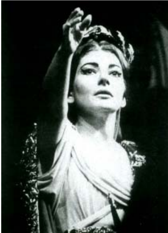
En Norma , Ópera de París, (1965)