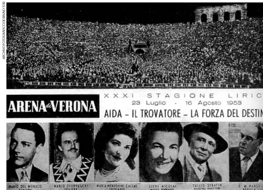
Cartel de la Temporada Operística en la Arena de Verona, (1953)

Trovador de 1950 con Kurt Baum), y otros de impresionante y conmovedora calidad, como la propia Lucia del 6 de octubre de 1952. ♣