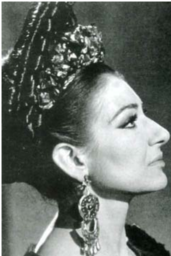
En Medea de Pier Paolo Pasolini, (1969)