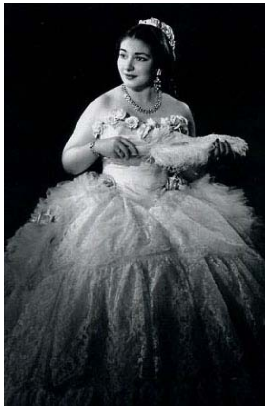
En La Traviata , México (1949)