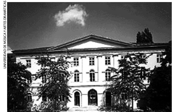
Sede de la Universidad de Música y Artes Dramáticas de Viena

Investigación decretó, por orden de 25 agosto de 1975, la disolución del Departamento de Danza, misma que concluyó en noviembre de 1978.