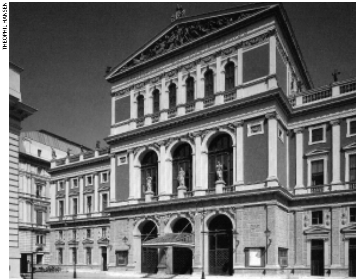
Fachada principal del Musikverein, sede conservatoriana de 1869 a 1913 en Bösendorferstrasse