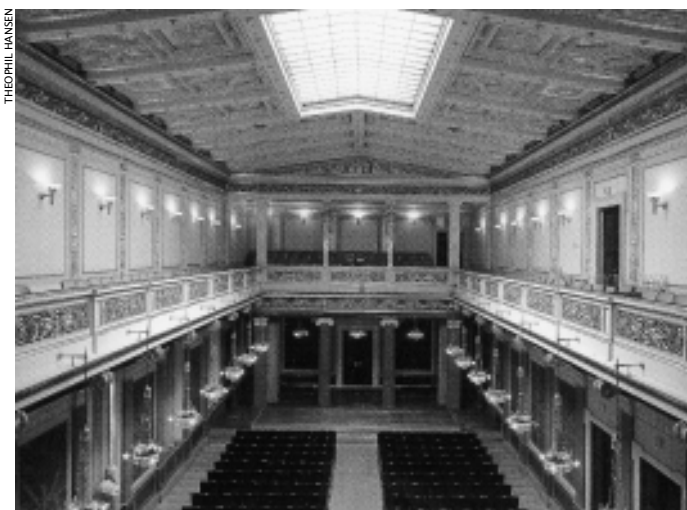
Sala Brahms, Musikverein

Así, ambas instituciones existieron una junto a la otra, lo que inmediatamente provocó problemas