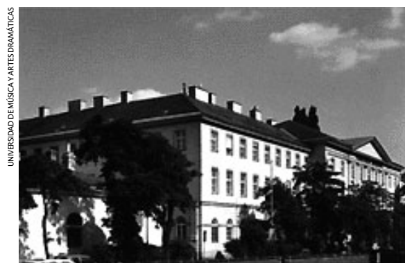
Edificio destinado a las áreas administrativas de la Universidad de Música y Artes Dramáticas ubicado en Anton von Webern Platz 1, Viena

(Viena, Austria) Estudió piano, canto y pedagogía musical en la Universidad de Música y Artes Representativas de Graz y musicología e historia del arte en la Universidad de Viena. Obtuvo su doctorado en 1967, año en que ingresó a la Biblioteca de la Universidad de Música y Artes Representativas de Viena, de la que es directora desde 1987. Ha publicado numerosos textos y guías de edición sobre aspectos musicológicos de alta calidad.