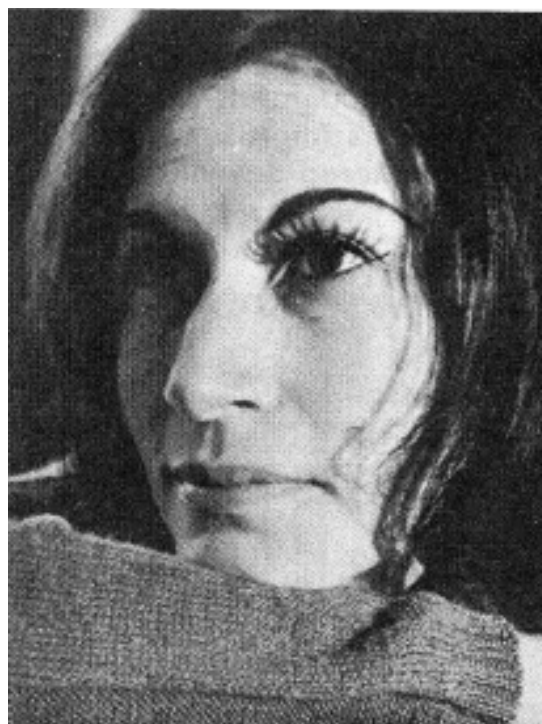
Aurora Serratos Garibay

DIRECTORA DEL CONSERVATORIO NACIONAL DE MÚSICA DE MÉXICO (1991-1994)