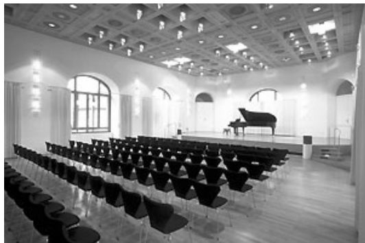
Sala de Conciertos “Velte”

Los estudios en la Universidad de Música Karlsruhe están divididos en cursos básicos y avanzados, siendo los primeros un prerrequisito de los siguientes. “Künstlerische Ausbildung” es un Diploma de cursos en el que pianistas, cantantes y compositores estudian los diversos