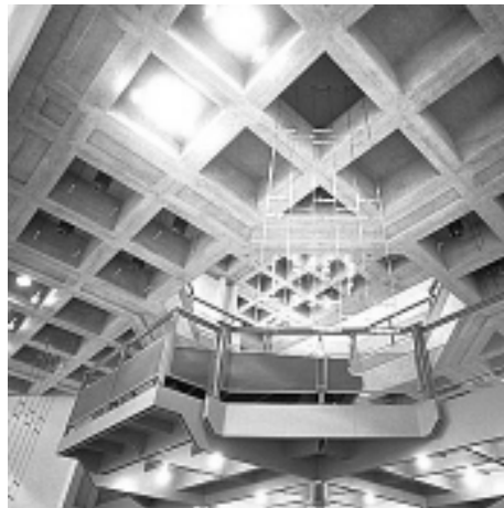
Vista del balcón ubicado en el hall

instrumentos de orquesta (cordófonos, aerófonos de metal y percusiones), a fin de ser preparados para el trabajo futuro en un grupo profesional, trabajo que también requiere de considerable habilidad solística. Los estudiantes que se ven más en un papel educativo, pueden optar entre un Diploma de cursos como “Musiklehrer” –en el que predomina la enseñanza instrumental–, o bien en las más diversas “Calificaciones de Enseñanza Profesional de las Artes en Escuelas Secundarias”, mejor conocidas en Alemania como “Schulmusik”. El espectro de cursos está complementado por cursos avanzados y materias adicionales. Los más elevados de ellos