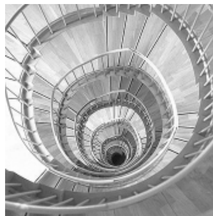
Cubo de la escalera central

Cantantes calificados están teniendo una revolucionaria penetración dentro de la vida actual del teatro moderno en el Instituto de Música de Teatro (Opernschule) dirigido por Renate Ackermann, que involucra el trabajo con los Opera Studio, un nuevo agregado de la Badische Staatstheater.