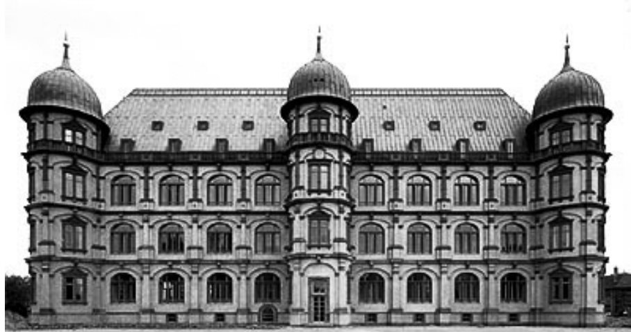
Scholss Gottesaue, Wiederaufbau (1989)