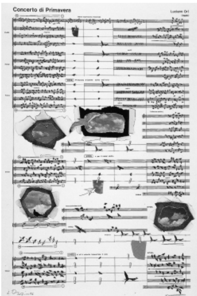
Concierto de primavera (1986) Luciano Ori (1928)

Sin embargo, ante este desafío, el Programa Nacional de Cultura propone “un nuevo modelo de política cultural, es decir, un nuevo modelo de relación entre el Estado y la sociedad en el ámbito de la cultura”, cuyo eje articulador es la “ciudadanización” de los bienes y servicios