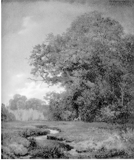
Paisaje danés (1841) Johan Thomas Lundbye (1818-1848)

vuelto locos; alargaron sus cuellos y alzaron el vuelo. Me paré de un salto y corrí detrás de ellos, pero sobrevolaron por un seto y después, desaparecieron de mi vista. Corrí hasta el gran cercado tan presto como mis piernas pudieron llevarme, pero fracasé en mi intento por cruzarlo. Rompí en llanto y cuando ya estaba por ir corriendo a Bramstrup en pos de ayuda, mis ojos descubrieron en el seto unos pasajes y una puerta al extremo opuesto del campo. Llegué tan pronto como pude, pero estaba cerrada. Así que la salté y a poca distancia, finalmente hallé a los gansos. Todavía estaban muy inquietos, cacareando y chillando, por lo que no logré juntarlos de vuelta. Por fin, tras un rato, me los ingenié para conducirlos hasta el portón, pero ahí fue donde comenzó la verdadera dificultad.