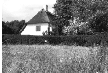
Casa donde transcurrió su infancia in Sortelung, cerca de Nørre Lyndelse en Fionia, Dinamarca

Como esta situación se repetía todos los días, no tardé mucho en ver la escena con aburrimiento; pero surgieron otros problemas. El lugar era aterradoramente solitario, extremadamente deprimente, y en mi aflicción anhelaba la hora de que llegara la noche para