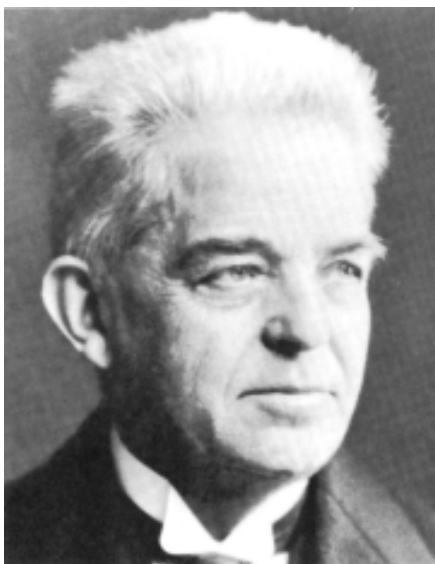
Carl Nielsen (1965-1931)

Sin embargo, una vez me ocurrió un accidente y mi excesivo entusiasmo recibió muy duro castigo. Fue un día en que el viento fresco soplabla. De pronto, miré que cuatro o cinco plumas de ganso flotaban en el agua como pequeñas barcas y navegaban directamente hacia una cuneta de musgo en el pantano. Examiné todas las orillas de los estanques y descubrí que sus lados enfrentando al viento se hallaban alineados de plumas. Por extraño que parezca, no estaban mojadas; la mayoría se encontraban dobladas tomando la forma de un barco. Me coloqué rápidamente la bolsa en mi cuello y casi la llené. Finalmente, vi un pequeño racimo de hermosas plumas blancas flotando en el agua, pero estaban tan lejos que sólo con un esfuerzo máximo podría alcanzarlas; de todas maneras, tenía la esperanza de que el viento me ayudara y, en cierto modo, así sucedió. De cuando