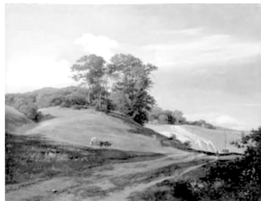
Sørup Vang (1841) Obra del paisajista danés Johan Thomas Lundbye (1818-1848)

Periodista, traductor, crítico musical, cantautor y musicalizador. Inició su carrera en el periodismo como articulista del periódico Excelsior y de los órganos de la UNAM: Los universitarios y Gaceta UNAM . Su vasto conocimiento de diversos idiomas le ha permitido ser traductor de inglés, francés y danés. Profesor de música en el Museo Universitario del Chopo. Desde los años setenta se ha dedicado a musicalizar la obra poética de Carlos Pellicer, la cual ha presentado principalmente para el INBA, el CNCA y otras instituciones educativas nacionales. Como cantautor es pilar del movimiento literario-musical llamado La canción rupestre . Ha participado en diversos foros artísticos internacionales. En el ámbito radiofónico ha sido programador y locutor además de musicalizador. Desde 1998 es coordinador de la sección de espectáculos del semanario Proceso .