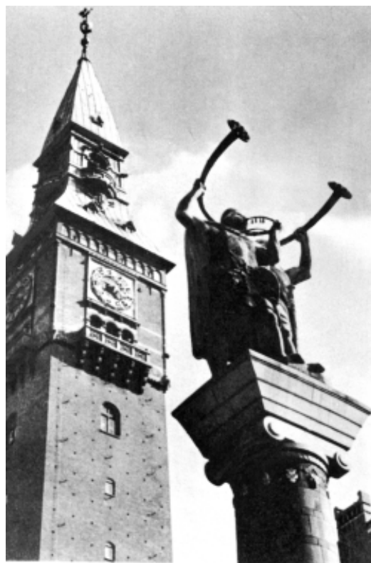
Instrumentistas de lur Plaza del Ayuntamiento de Copenhague, Dinamarca

a mi cara, vibrando como un resorte de metal; entonces, como un relámpago de luz se lanzó hacia un lado, para otra vez revolotearme. Algo buscaba de mí; tenía colores muy vistosos, pero nunca hubiera podido agarrarla, si bien era lo que más deseaba. Era algo que nunca vería en la campiña, pues mientras caminaba por el rígido y aburrido rastrojo, recordaba los estanques como un mundo entero de gran interés: un mundo que ahora extrañaba.