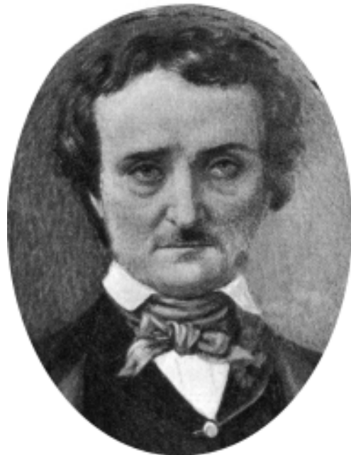
Edgar Allan Poe (1809-1849)

Así las cosas y en mis andanzas literarias – lecturas a veces sueltas y a veces ordenadas, en ocasiones cargadas de frenesí poético y en otras de rutina de investigador– me topé un día con un formidable cuento de Edgar Allan Poe: El Diablo en el Campanario . Al comienzo del mismo aparece a manera de epígrafe una locución antigua que dice así: “¿Qué hora es?” Su profundidad